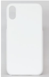
하드 무광 케이스