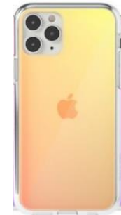
글러시 하프미러 케이스