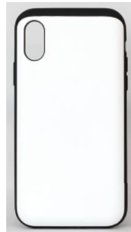
카드 슬라이드 케이스