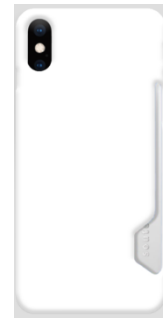
카드 스냅 케이스