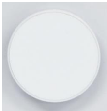
무광 철판 스마트톡 화이트 / 블랙 바디