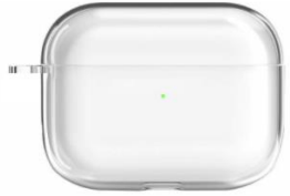
에어팟1,2세대 / 프로 버즈 / 라이브 투명 젤리 케이스