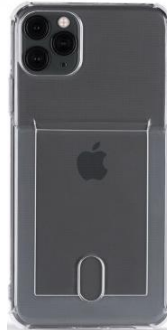
카드 젤리 케이스