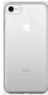
투명 하드 케이스