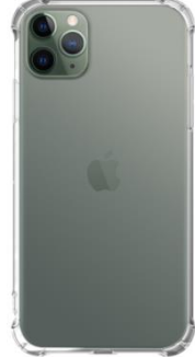
방탄 젤리 케이스