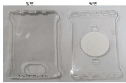
카드 슬롯 케이스