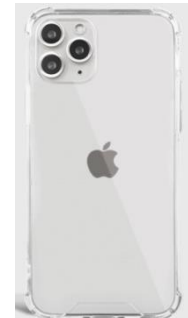
탱크 젤하드 케이스