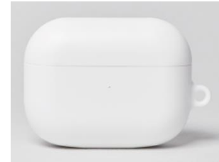
에어팟1,2세대 / 프로 버즈/ 라이브 무광 케이스