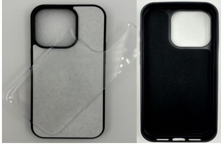
에폭시 스웨이드 케이스