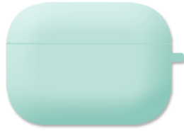
에어팟1,2세대 / 프로 버즈 / 라이브 컬러 젤리 케이스