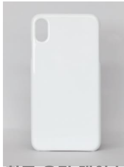
하드 유광 케이스